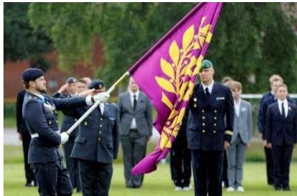
Parad för fanan.