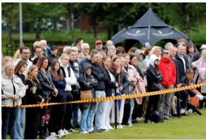
I väntan på avslutningsceremoni GU.

Den 14 juni muckade de värnpliktiga som utbildats på FMTS under elva månader. Anhöriga var på plats och delade dagen med sina soldater. Tack för den här tiden och på återseende!