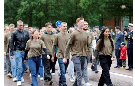
Och så marscherade de ut genom grindarna.