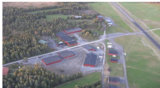
Översiktsbild Museiområdet och del av flygfältet

De fyra ideella föreningarnas insatser sker främst genom arbete i tre gemensamma arbetsgrupper: